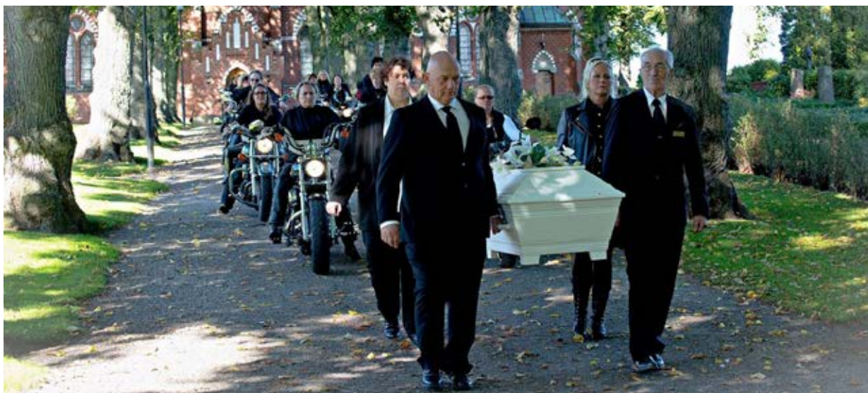
Låt ett livslångt intresse ta plats under ceremonin.