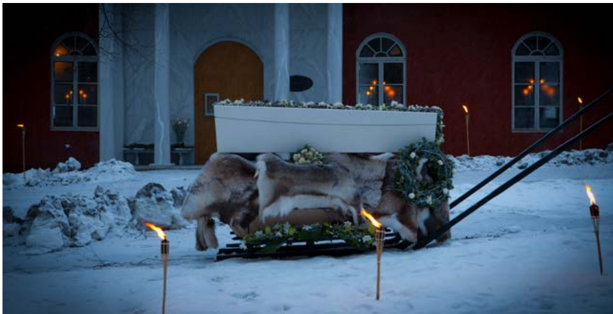
Låt årstiden vara en del av upplevelsen.