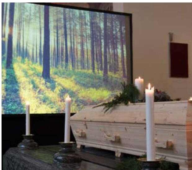
Flytta in naturen, minnen och bilder med hjälp av en storbildsskärm.