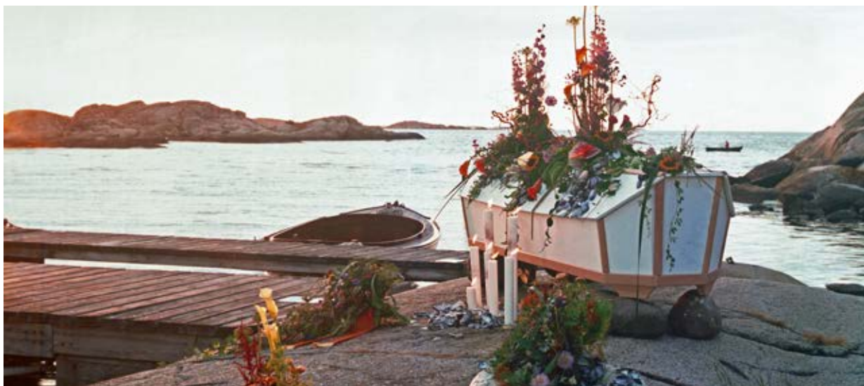
Med hav och himmel nära, känns dina nära aldrig långt bort.