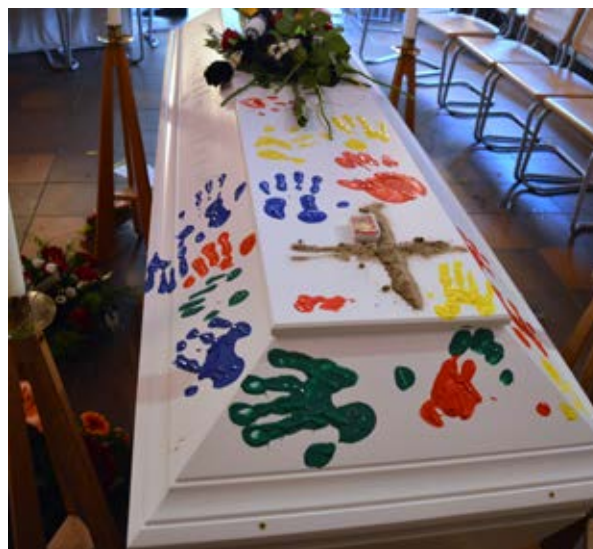
En sista hälsning med en klapp av fingerfärg.