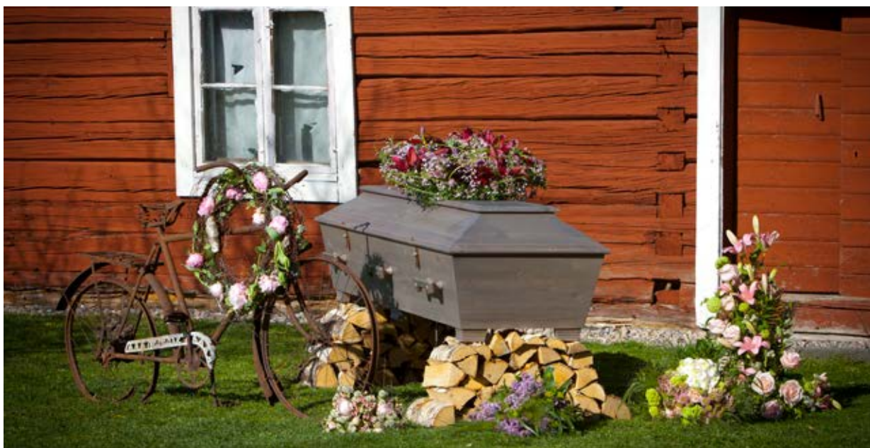
En vacker och traditionell ceremoni på en kär plats.