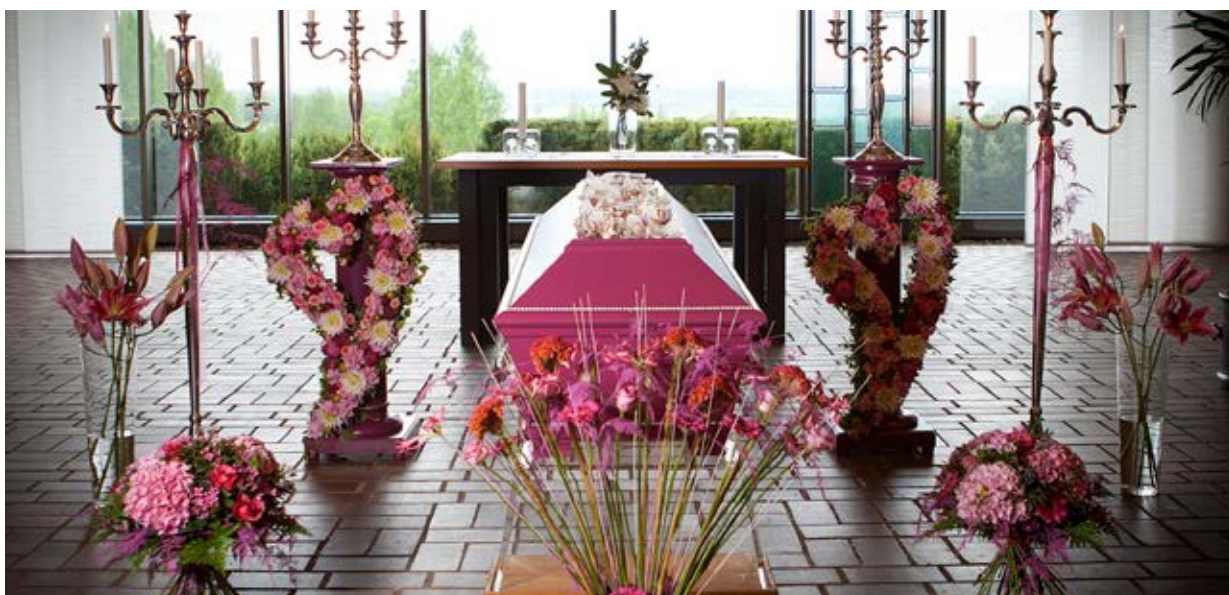
Favoritfärgen i blommor och utsmyckning gör ceremonin personlig.